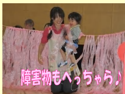
障害物もへっちら♪

患者様とのふれあい競技もありました!!サイコロの出た目で、患者様と握手したり、肩たたきをしました。参加した患者様も終始にっこり。