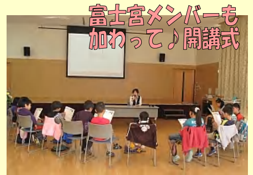
富士宮メンバーも 加わって♪開講式