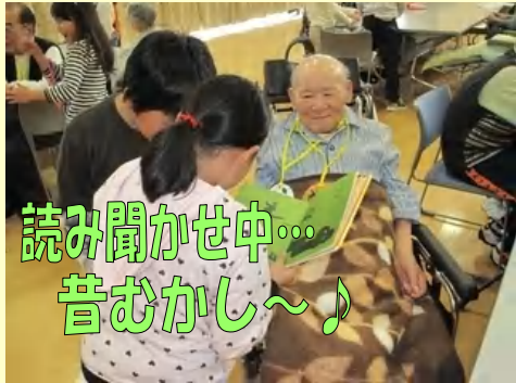
読み聞かせ中... 音むかし~♪

毎年4年生が授業の一環として、年間を通して当院に交流に来てくれています。小学生が班ごとにそれぞれ考えてきたレクリエーションを患者様と楽しみました。